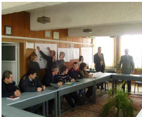
Публично обсъждане на “Анализ разходи-ползи” на инвестицията за проекта проведено на 25.02.2011 г.

На 25.02.2011 година в заседателната зала на Община Белене се проведе публично обсъждане на пълен анализ „разходи-ползи“ на инвестиционно намерение “Частично изграждане на канализационна мрежа с ПОСВ и рехабилитация на съществуващата водоснабдителна мрежа на гр.Белене”. Проведеното общественото обсъждане се реализира като част от дейностите в рамките на проекта.