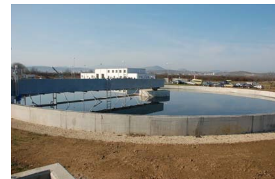
Утаител на пречиствателна станция

Проект с рег. № 58-131-C074 „Комплексна техническа помощ за частично изграждане на канализационна мрежа с пречиствателна станция за отпадъчни води (ПСОВ) и рехабилитация на съществуващата водоснабдителна мрежа в град Белене”